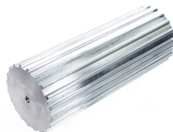
HTD 3M Mat. Aluminium